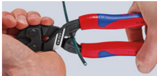
71 01 / 02 / 12 and 71 32 200 รองจับบนตัวคีม